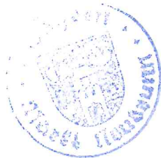
Menig 1. Bürgermeister