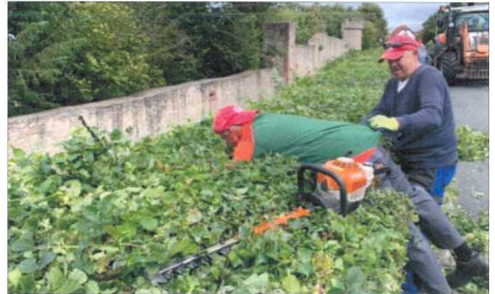
Helfernetzwerk beim Einsatz im Hagweg.